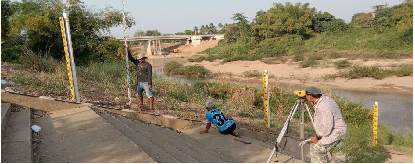
ภาพถ่ายแนวเสาระดับน้ำ สถานี Y.3A แม่น้ำยม อ.สวรรคโลก จ.สุโขทัย